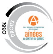
Table régionale de concertation des personnes âgées du Centre-du-Québec

La Table de concertation des personnes âgées de la Capitale-Nationale a vu le jour en 1999. Elle compte 61 organismes membres et représente plus de 150 000 aînés. Elle constitue un lieu régional d'échanges, de concertation et de partenariat. Conscientes de l'importance de faire entendre la voix des aînés dans l'ensemble de la région, la Table de la Capitale-Nationale a mis en place des comités de travail permanents qui répondent aux grandes préoccupations des aînés : défense des droits, appauvrissement des aînés et espace intergénérationnel.